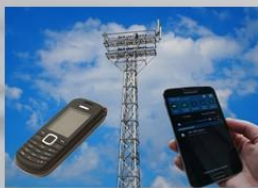
Средства сотовой связи