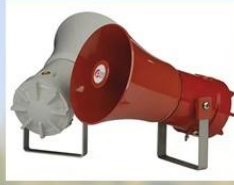
Выносные акустические устройства (BAU)